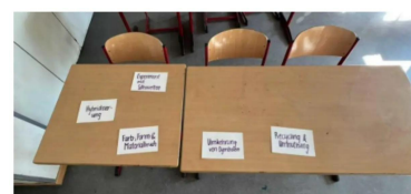
Einführung 2. Doppelstunde