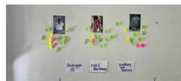
Eigene Entwürfe kreieren