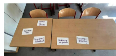
Einführung 2. Doppelstunde