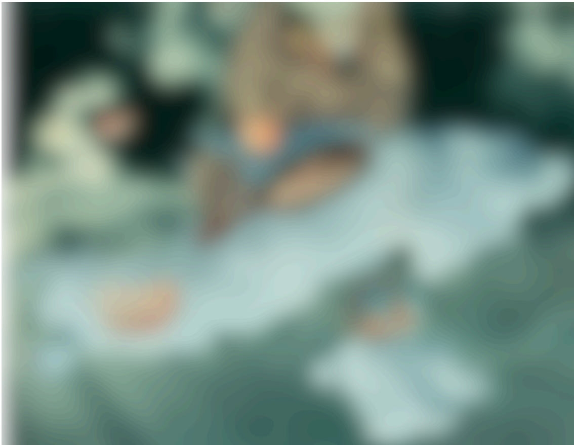
Abbildung 5: Hannah Höch, Eule mit Lupe, 1945. Collage.