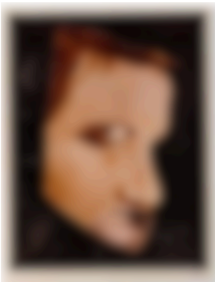
Abbildung 6: Hannah Höch, Der Melancholiker, 1925. Collage.