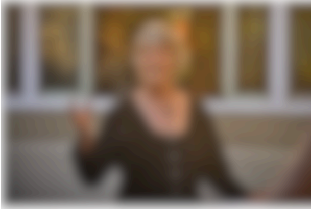
Abb. 1: Donna Haraway