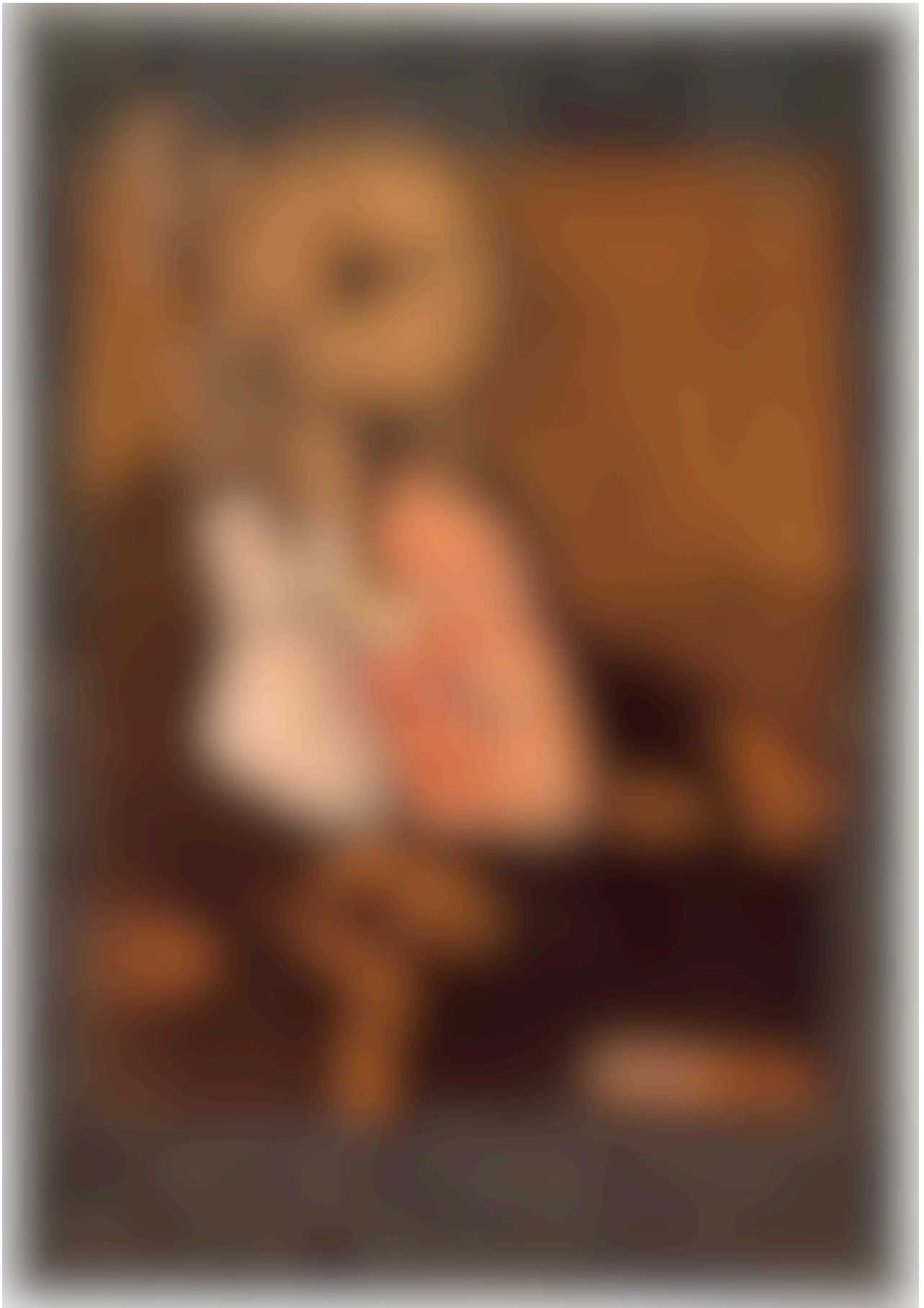
Abbildung 4: Raoul Hausmann, Selbstporträt des Dadasopher, 1920. Collage.